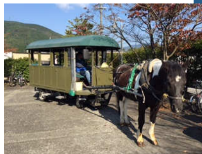
紅葉も綺麗に色づき始めていました

辻馬車で観光する者や、湯の坪街道でゆっくり好きなものを食べ歩きする者・金鱗湖を眺める者など各自自由に過ごしました。